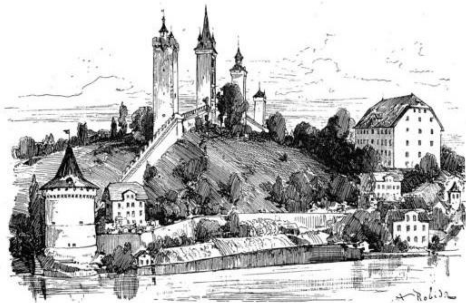
Lucerne. — La vieille enceinte.